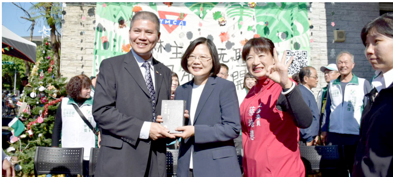
陳志忠長老（左）致贈蔡英文總統聖經

「我自出母胎就被交在你手裡・從我母親生我、你就是我的 神。」（詩 22:10）近十幾年來有幸擔任謀生工作以外的職務，41 歲擔任互助社社長 6 年，接續而來 48 歲接任松年大學 6 年校長，還有 3 年的基甸會會長，所經歷神的恩典真是數算不盡啊！