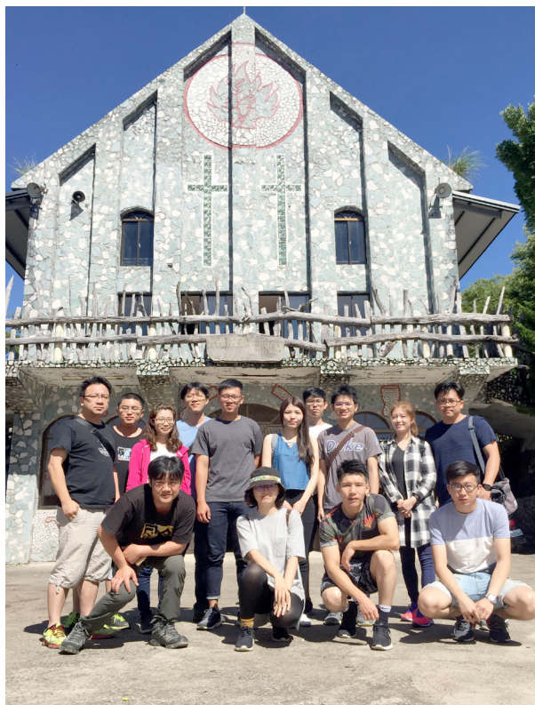
璇韻小組於鎮西堡教會合影

抵達部落、簡單享用泰雅族風味的竹筒飯作為午餐後，一行人早已忘卻顛簸路途的疲憊，抓緊時間前往著名神木群的所在地，想要在步道的深林處，一窺世界起初上帝創