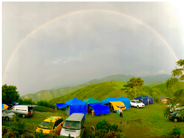
活泉牧區之露營烤肉活動

我想上帝一定喜悅我們的相聚，今天弟兄姊妹冒著滂沱大雨，一路趕往深山，展開兩天一夜活泉牧區的露營活動！