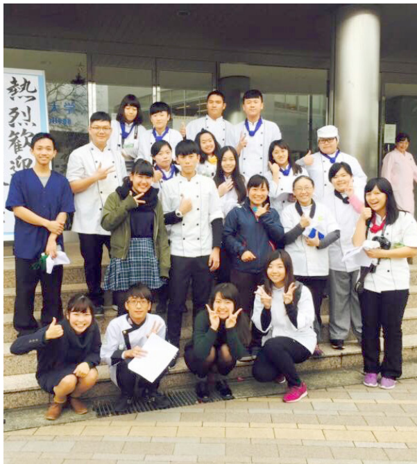
林子好姊妹（第一排右二）帶學生參加國際教育旅行

徨，但我深信在我人生道路裡，主有祂的旨意及安排。當初董事會認為我是基督徒，在錢財管理方面較能讓他們放心，因為有了這份信任，使我在錢財管理及工程採購事上，更加謹慎小心；作基督徒應有的處事態度，我相信神會賜給我更多的資源，使我得著祝福，當我不佔公司的便宜、不佔用公司資源，神就會用祂的方式來使我蒙福。「 要穿戴上帝所賜的全副軍裝，就能抵擋魔鬼的詭計 」（弗 6:11）。